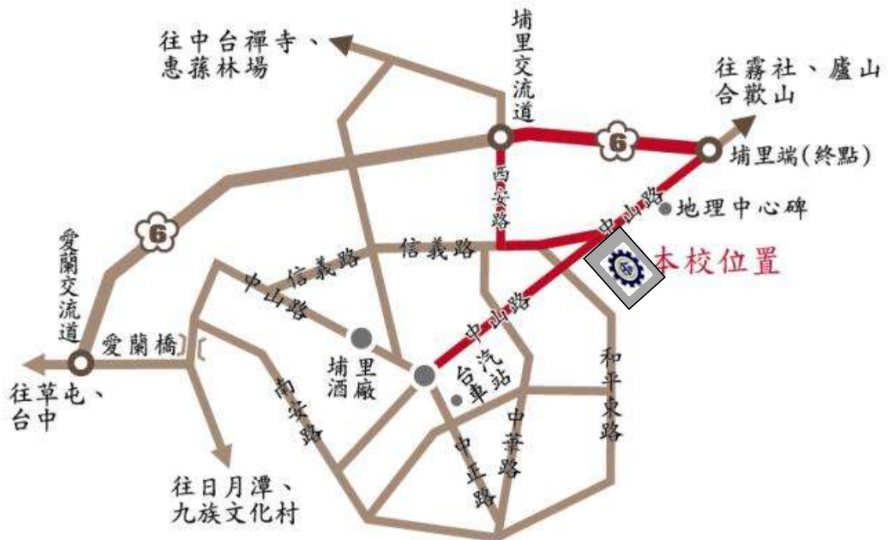
附圖一 承辦學校位置圖